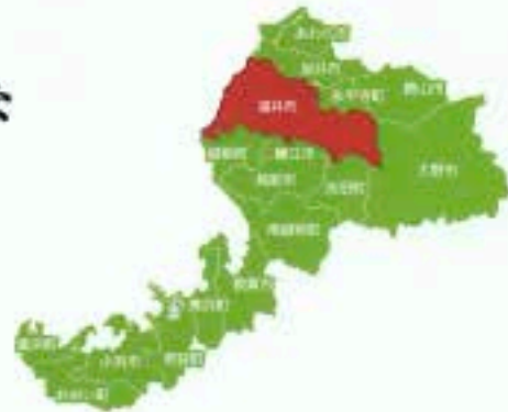
福井市全域の地図