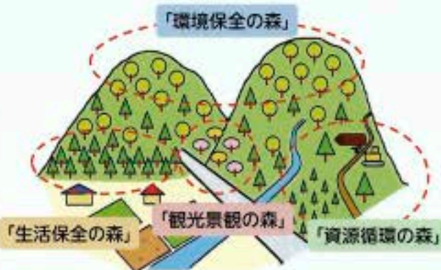
(100年後の姿を目指すべき森林のイメージ)